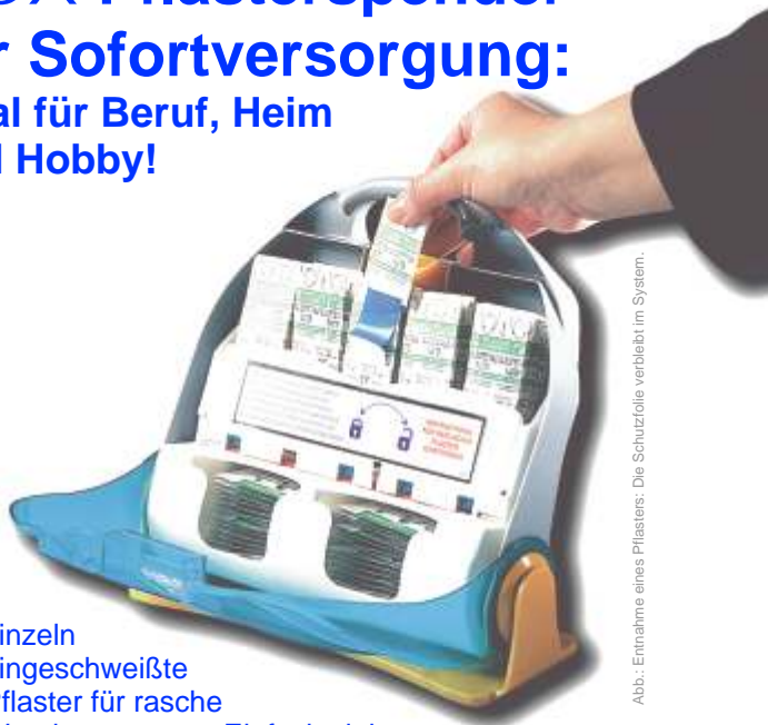
Abb.: Entnahme eines Pflasters: Die Schutzrolle verbleibt im System.

einzel eingeschweißte Pflaster für rasche Wundversorgung. Einfach ziehen und das Pflaster ist einsatzbereit Staubdicht verpackt - aufkleben ohne Berührung der Wundauflage! Diebstahlsicher: wer stiehlt Pflaster ohne Schutzfolie auf der Rückseite? Austausch der Füllungen mit beiliegendem Spezialschlüssel. Inhalt: 5x 10 Pflaster und 20 Wundtücher Mit Wandhalterung (auch als Standfuß).